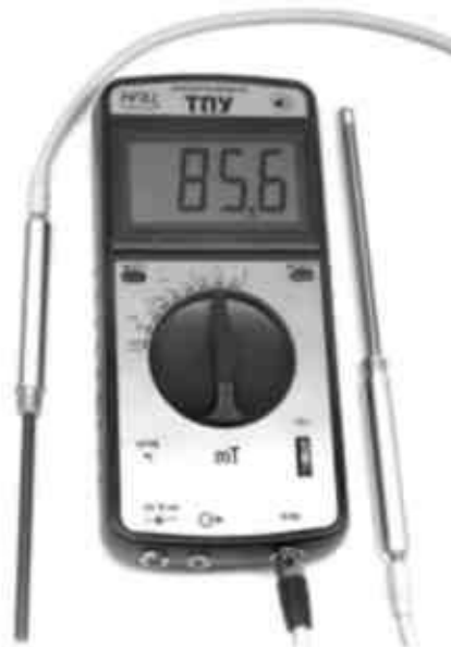
Рис. 1. Внешний вид миллитесламетра портативного универсального ТПУ

4.4. На передней панели электронного блока (рисунок 1) расположены: